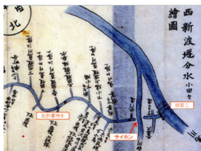
1814年(文化11年)以降の 西新波堰分水絵図