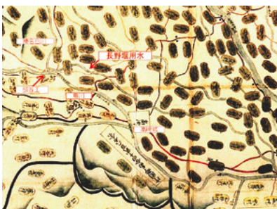
1645年(正保2年)正保国絵図