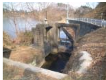
鮎川貯水池分水工