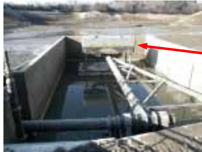
早川貯水池取水口