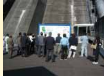
草木ダム下部にて