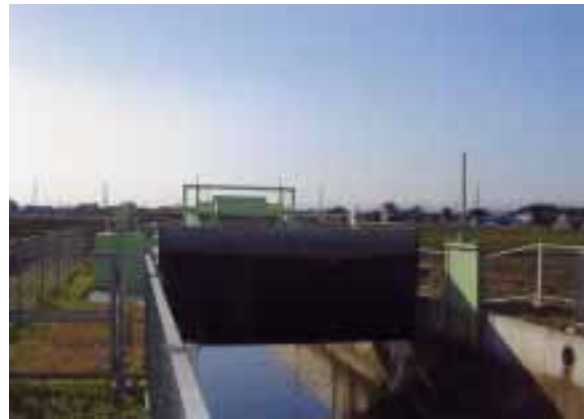
中川にあるウォッチマンゲート