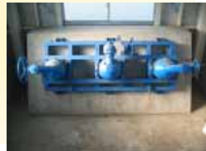
阿左美沼取水口 斜樋3門