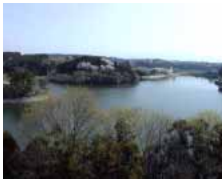
鳴沢湖 及び遊歩道