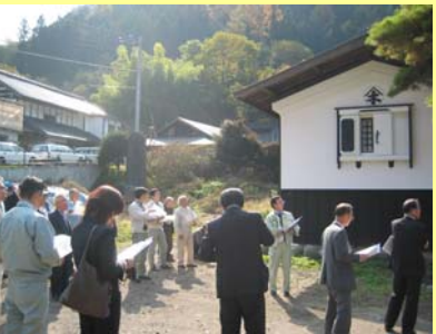
田園空間整備事業説明