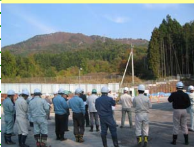
生枝地区概要説明