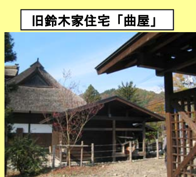
旧鈴木家住宅「曲屋」