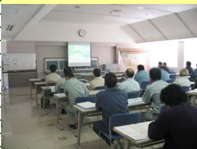
赤城西麓概要説明