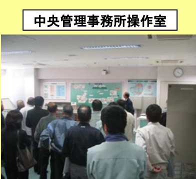
中央管理事務所操作室