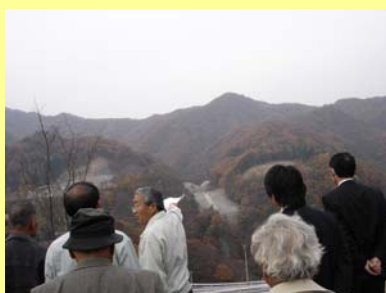
川原湯代替地からのダムサイト