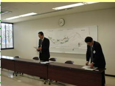
協議会長(代理)挨拶

視察施設：雁が沢ランプ、雁が沢トンネル、長野原めがね橋、やんば館、 各代替地、ダムサイト等