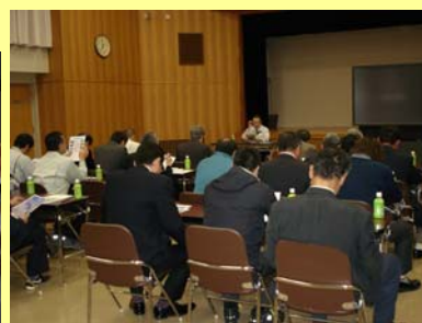
環境用水利活用促進事業の説明