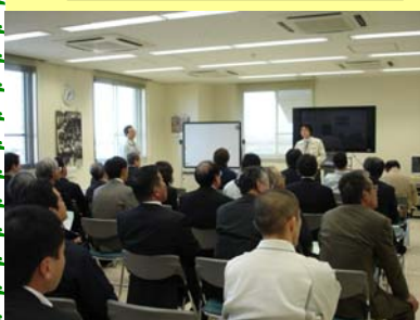
親松排水機場概要説明