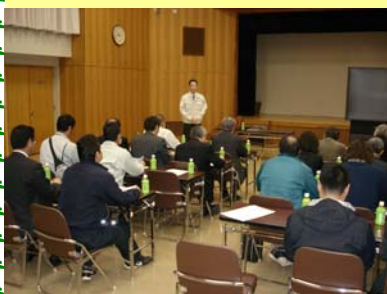
亀田郷土地改良区概要説明