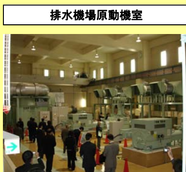
排水機場原動機室