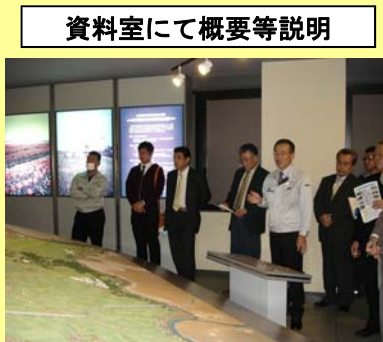
資料室にて概要等説明