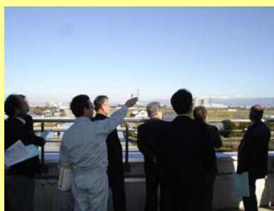
屋上にて地形等の説明