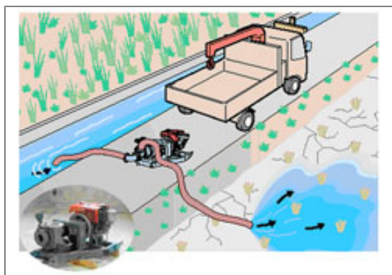
陸上ポンプの設置例