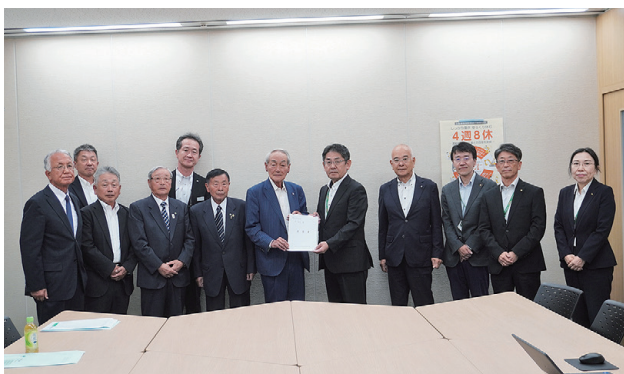
岸農政部長へ要望書の手渡し