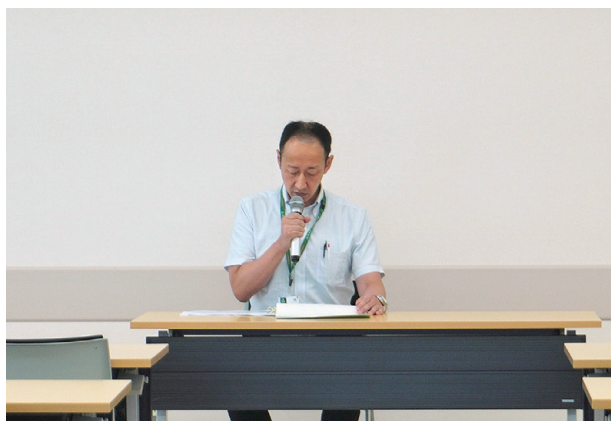
「土地改良法の改正等について」 群馬県農政部農村整備課管理指導係 林補佐