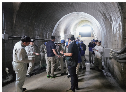
坂東合口取水口(第一取水口)

今回参加した生徒は、昨年度に出前講義及び実習を受けており、農業土木や土地改良区についてより理解が深められたことと思います。