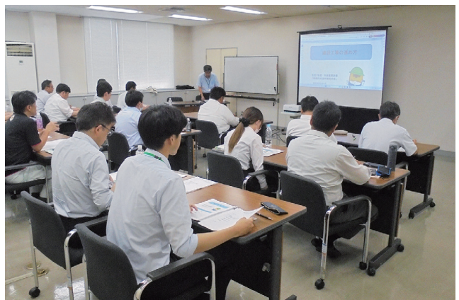
第1回 技術研修会の様子