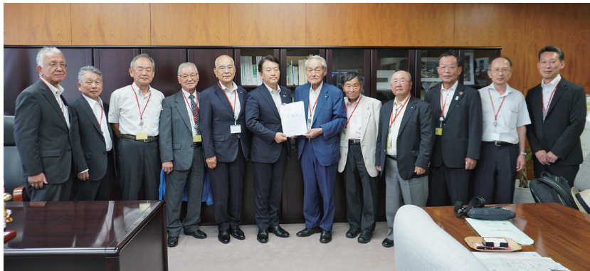
笹川博義 農林水産副大臣