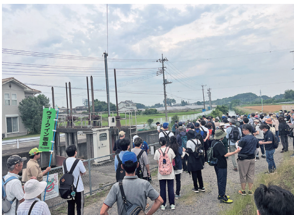
ウォーキングの様子

昼食として地元産米のおにぎり、地産作物を使用した豚汁、きゅうりの1本漬けが参加者全員に提供され、アンケートの回答により地元産米ときゅうりがお土産として配られました。