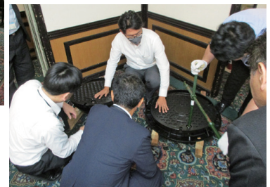
セキュリティ対策を行ったマンホール蓋製品の展示