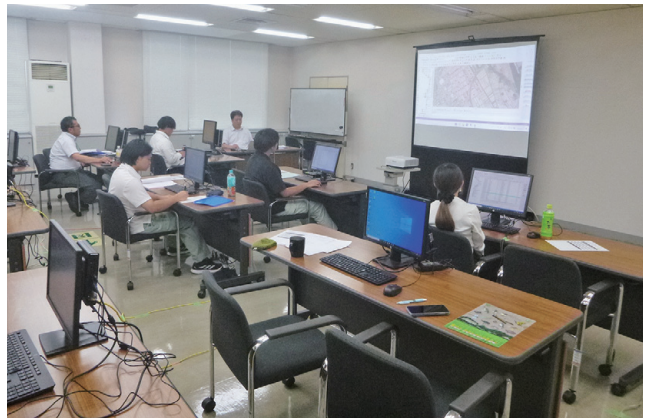
第2回 技術研修会の様子