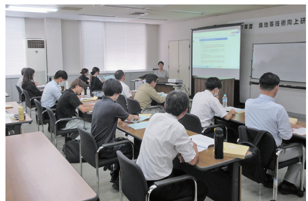
関東農政局 農村振興部 土地改良管理課 高島土地改良指導官