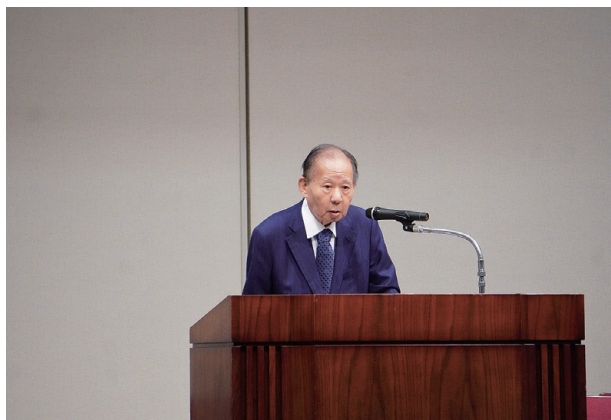
主催者挨拶 全国水土里ネット 二階会長