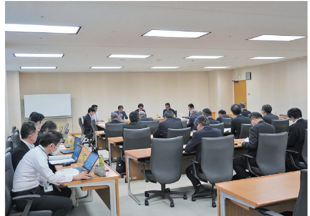
政調懇談会の様子