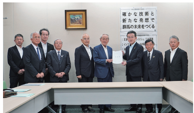
宮前県土整備部長へ要望書の手渡し