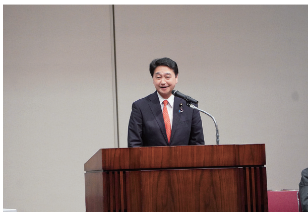
来賓祝辞 都道府県水土里ネット会長会議顧問 進藤参議院議員