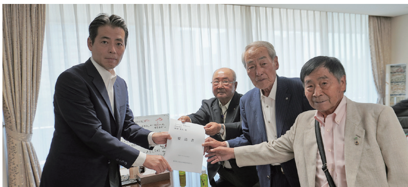
福田達夫 衆議院議員